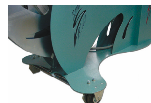
Mobile grâce au dispositif de transport intégré